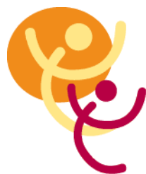
Table de concertation des groupes de femmes de la Montérégie